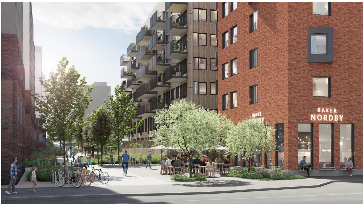
Illustrasjon av gatetunet Børsteveien sett fra Peter Møllers vei. Det vil være nedsenket kantstein ved innkjøringen, men det vises ikke på denne illustrasjonen. Avvik vil forekomme

Gatetunet Børsteveien vil derfor bli utformet for lav kjørehastighet og med et dekke som ikke er av asfalt og kjørebane vil ikke bli rettlinjert. Det vil ikke bli tillatt med biloppstilling. Gatetunet vil bli utformet med regnbed/beplanting og trær, samt utstyres med fast møblering som benker og installasjoner for lek, og minst 20 sykkeloppstillingsplasser. Det vil ikke være tillatt med gjennomkjøring, med unntak for renovasjon.